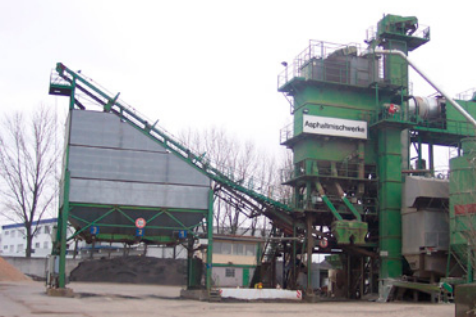
Temperaturregelung in einer Asphaltmischanlage

sind Pyrometer hervorragend dazu geeignet, die Temperatur des sich bewegenden Mischguts in der Trockentrommel zu messen und eine gleich bleibende Mischgut-Temperatur sicher zu stellen. Zum anderen wird auf der Förderstrecke zum Lager-Silo mit einem zweiten Pyrometer die Fertigprodukt-Temperatur gemessen.