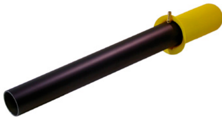
Montagerohr für IN 5 und IN 300 speziell entwickelt für Asphaltmischanlagen