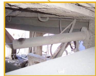
Temperaturmessung am Mischgutaustritt